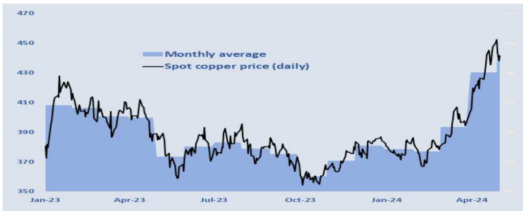
<글로벌 구리 가격 추이>