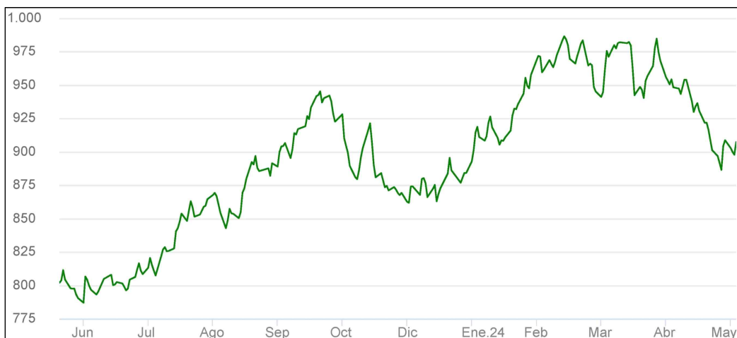
<달러당 페소 환율 추이(CLP/USD)>