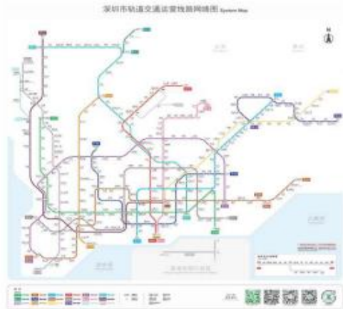
<선전시 지하철 노선도(2024년 5월 기준)>