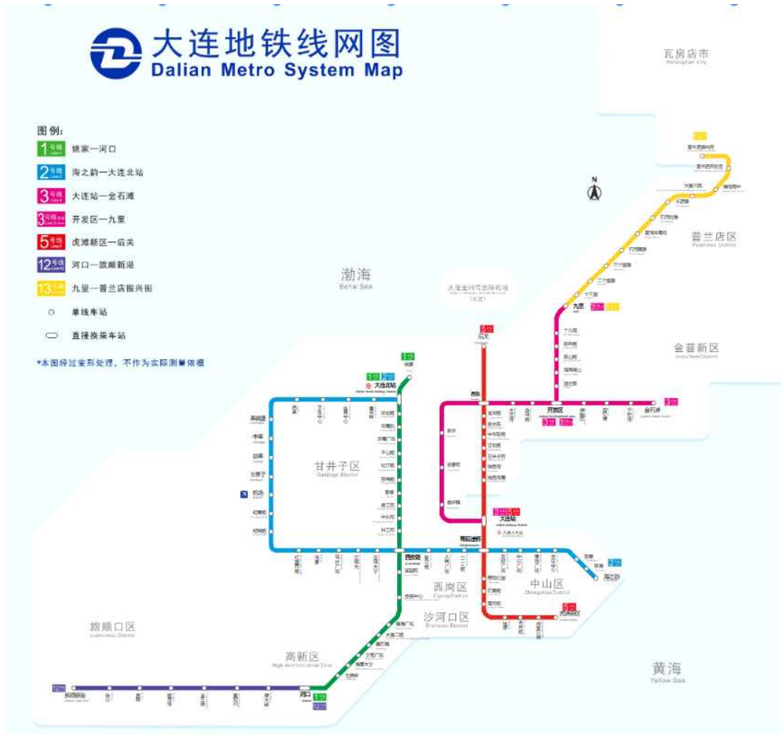
<다렌 지하철 노선도>