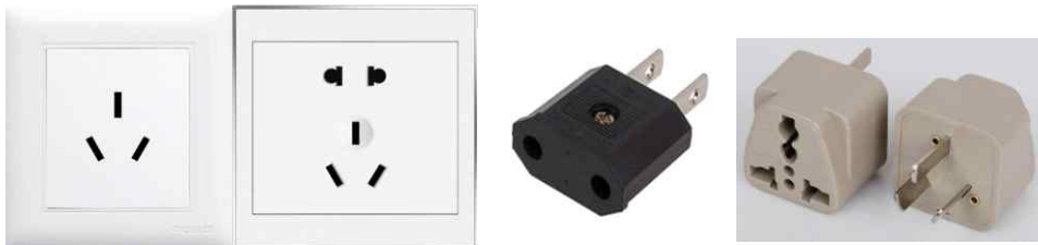
<중국 콘센트 및 멀티 어댑터 사진>