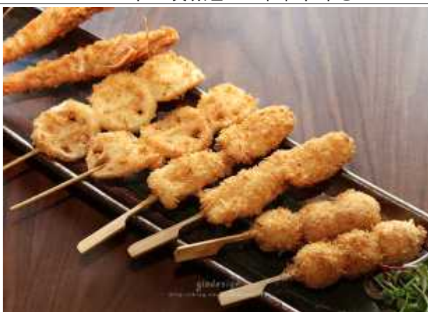
쿠시카츠 : 돼지고기와 야채를 꼬치에 꽂아 고온의 기름에 튀겨낸 것