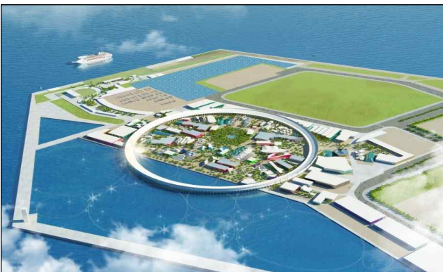
EXPO 2025 엑스포장 조감도