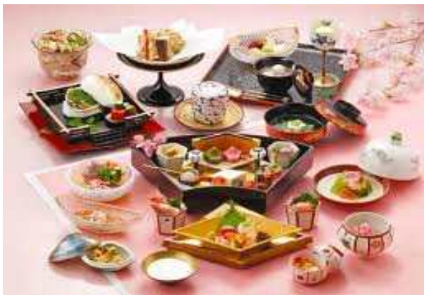
교(京)카이세키 : 생선회, 조림, 구이 등이 코스로 제공되는 정식 요리