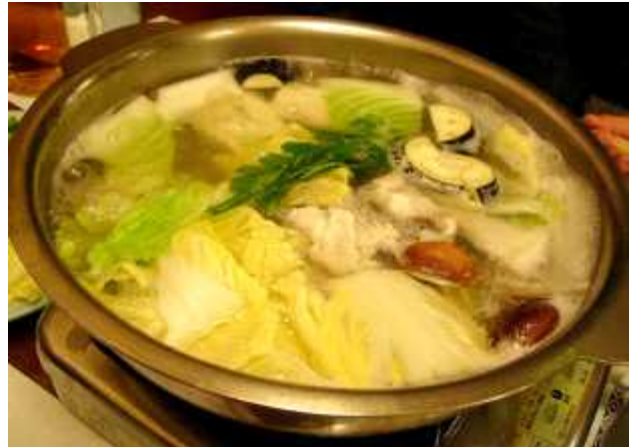
뎃치리 : 신선한 해물, 두부, 야채를 넣은 복지리