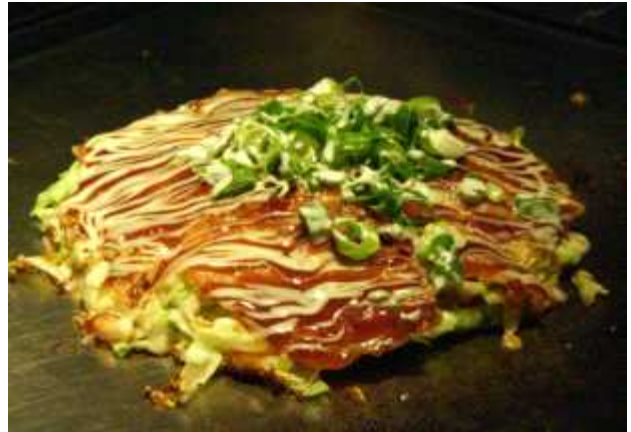
오코노미야키 : "오코노미" 는 취향이라는 뜻으로 한국의 빈대떡 같은 음식