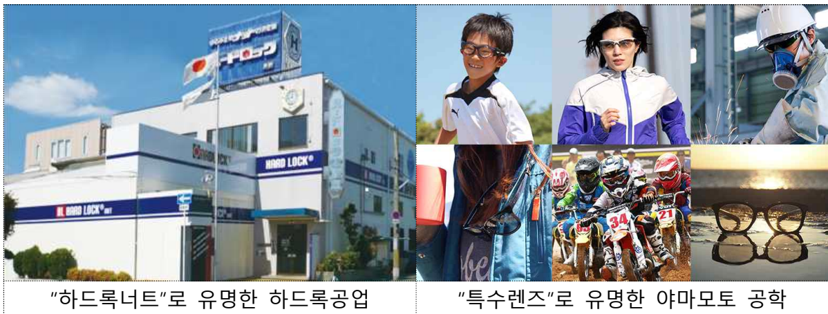
"하드록너트"로 유명한 하드록공업