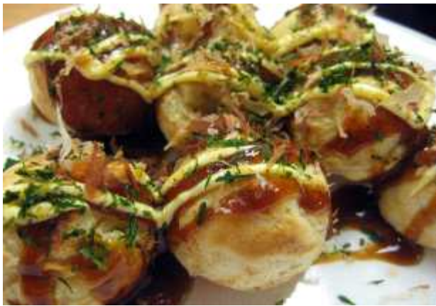
타코야끼 : 삶은 문어가 들어있는 작고 둥근 공모양의 음식