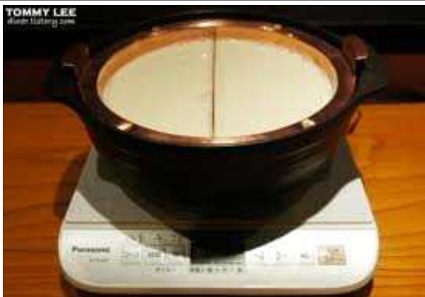
유바 : 두유에 콩가루를 섞어 끓여 그 표면에 영긴 얇은 껍질을 건어 말린 것을 미지근한 물에 살짝 담그고 불린 것. 주로 냄비요리에 이용