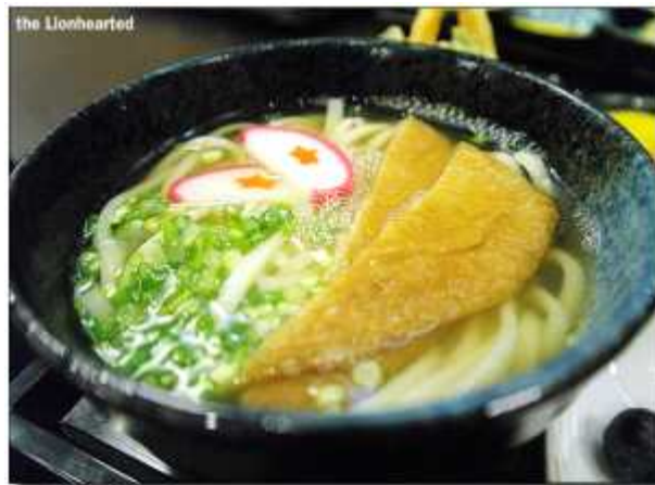
키츠네 우동 : 국물에 얇은 유부를 넣어 만드는 싸고 맛있는 오사카식 우동