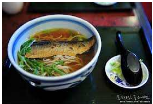
니신소바 : 말림과 훈제를 반복하고 조려낸 청어를 소바에 얹어서 함께 먹는 음식으로 분지지형인 교토에서 생선을 먹는 독특한 방법 중 하나