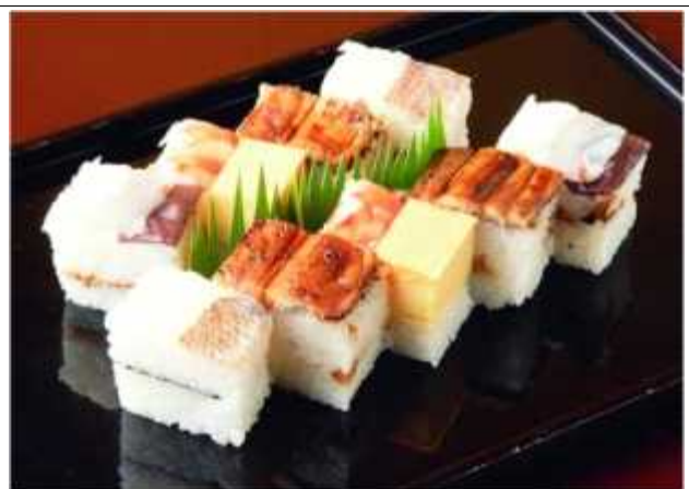
하코스시 : 정사각형 틀에 밥을 넣고 눌러서 만든 오사카식 초밥