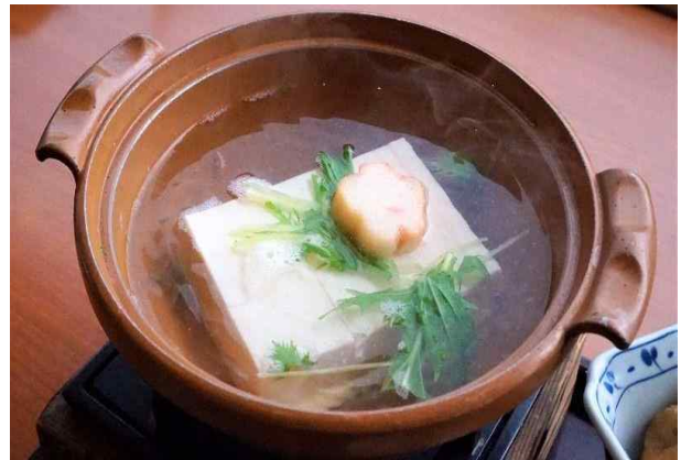
유도후 : 부드러운 두부를 다시마 국물에 삶아 양념장에 찍어 먹는 요리