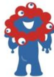
EXPO 2025 공식 캐릭터