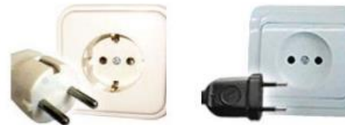
<알제리 콘센트 형태>