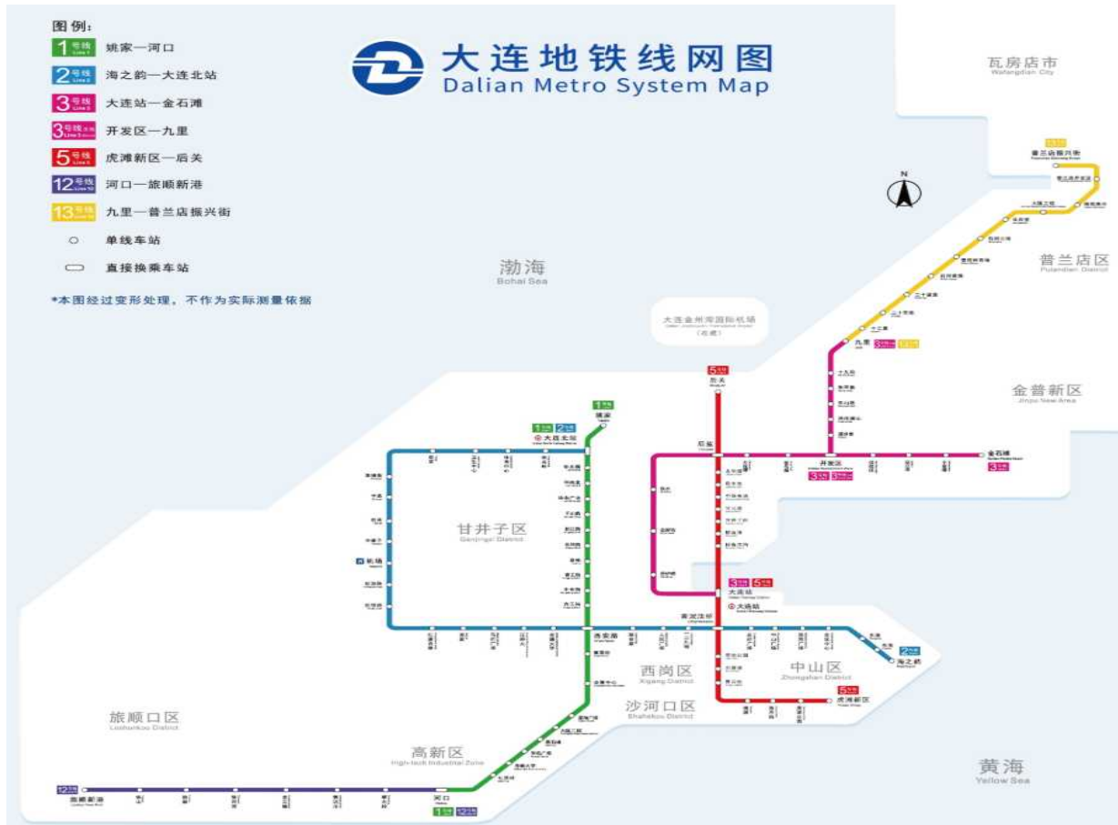
<다롄 지하철 노선도>

○ 지하철 : 현재 1호선, 2호선, 3호선(경전철), 5호선, 12호선, 13호선 운행 중